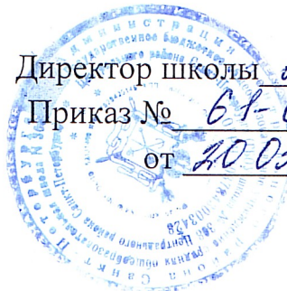
ГРАФИК ПРИЕМА ЗАЯВЛЕНИЙ В 1 КЛАСС 2025-2026 учебного года