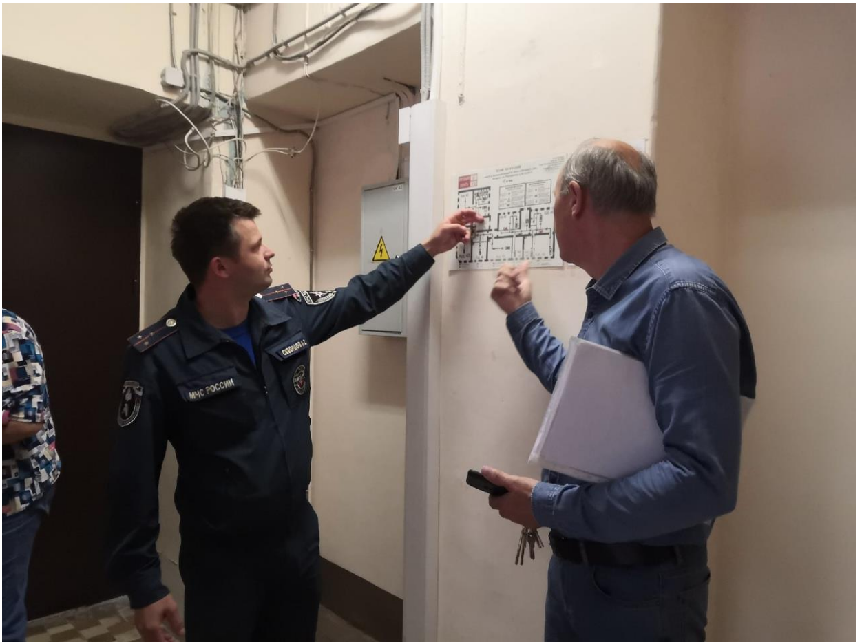
Управление по Центральному району 20.07.2020