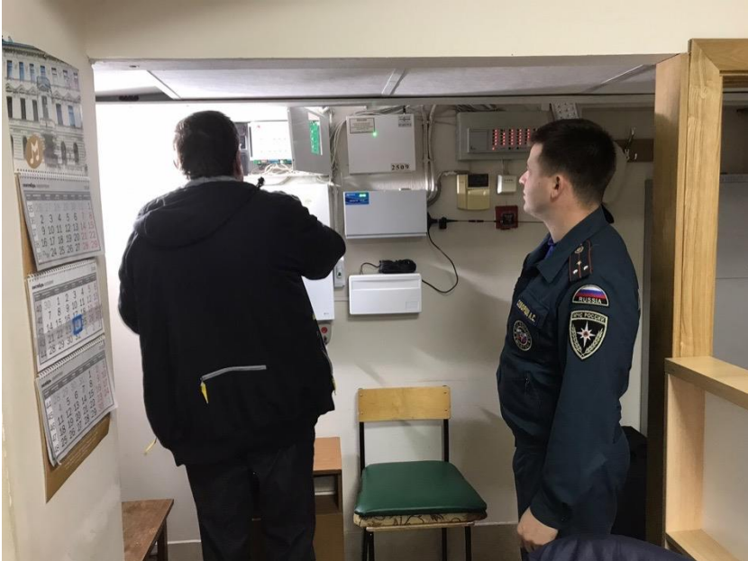
ОНДПР Центрального района 16.01.2020